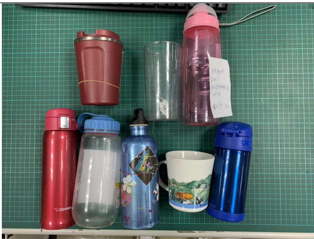
說明：環保杯瓶數個